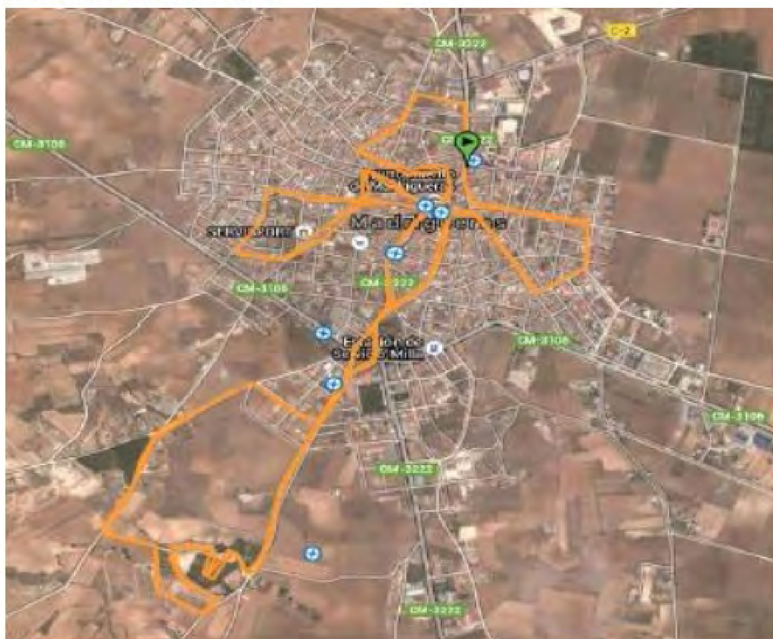
MAPA DEL RECORRIDO