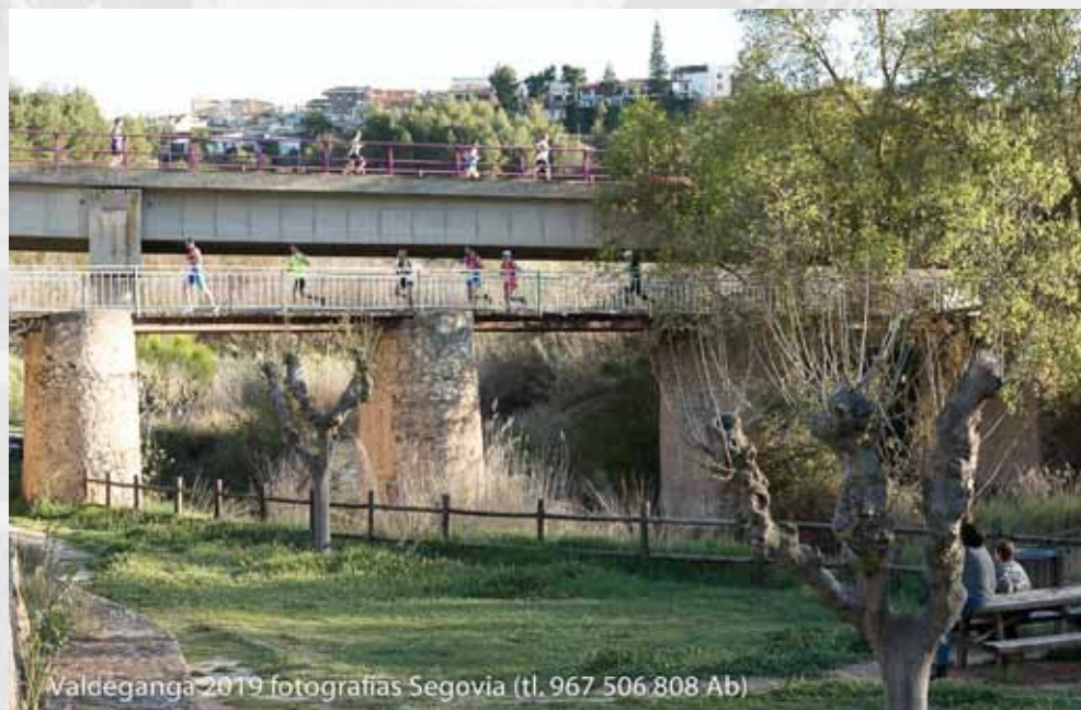
Valdeganga 2019