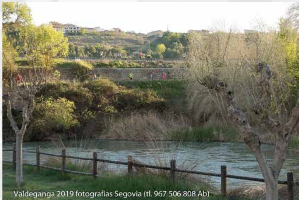
Valdeganga 2019

La carrera de Valdeganga es ideal por varias razones, por su situación geográfica central, por su distancia, 8850 mts es accesible para cualquier persona que se quiera iniciar a correr, por su recorrido, ya que discurre junto al río Júcar y se corre por una senda muy atractiva recién florecida la primavera y para llegar a meta habrá que subir la cuesta del río “ una peculiar cuesta” que siempre está amenizada por la Banda Musical del municipio. Realmente es una carrera para disfrutar corriendo, prueba de ello, es que en cada edición se incrementa el número de corredores que quieren repetir.“