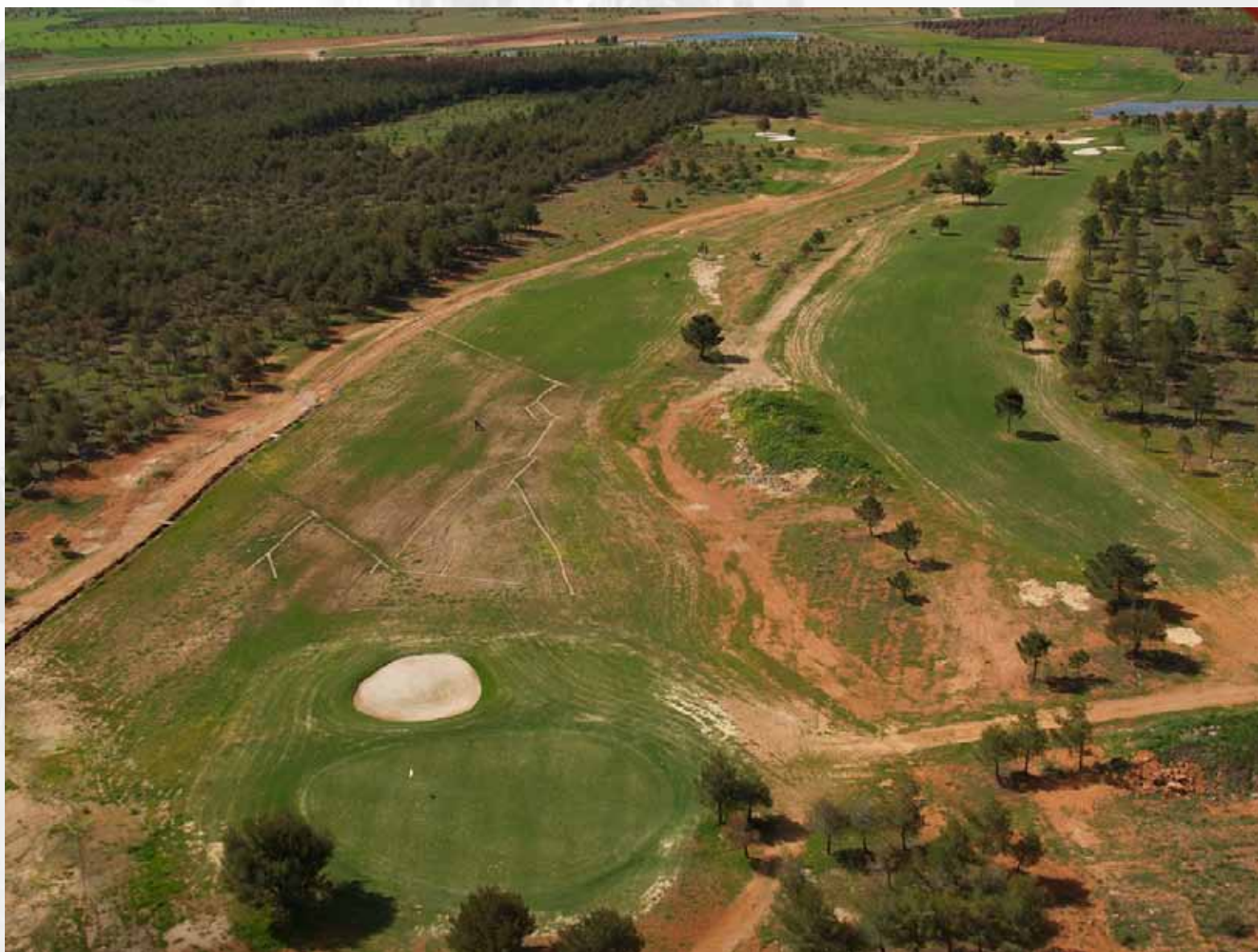
Foto representativa del recorrido

XXII CIRCUITO PROVINCIAL CARRERAS / TRAIL 2023